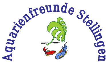
Über 50 Jahre jung und aktiv